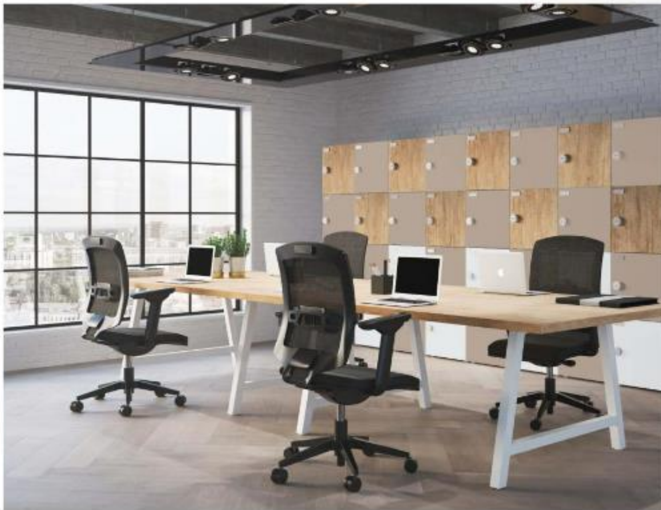
Table Cohésion - Cohesion Table