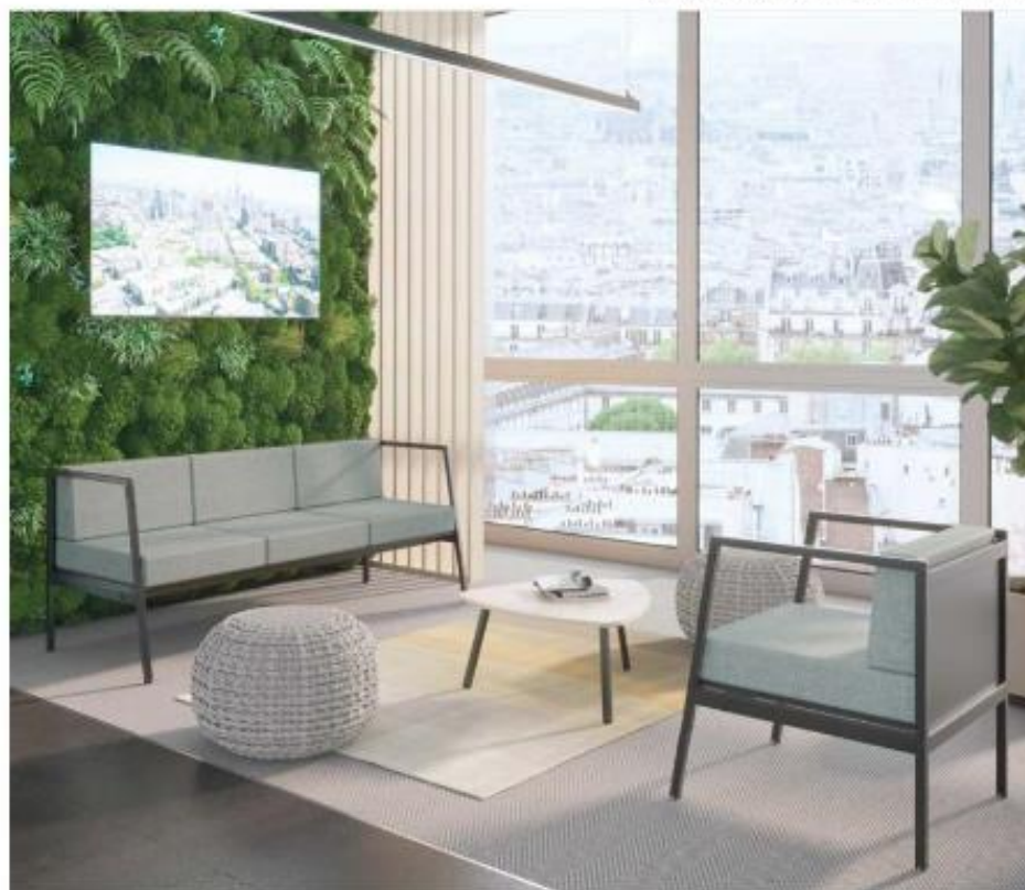
Canapé et fauteuil Alto - Alto Settee and Armchair

Modularity, comfort, well-being are at the centre of employees' motivations in the workplace; spaces dedicated to communication, formal or informal, open or closed, promote communication and social bonds within shared spaces.