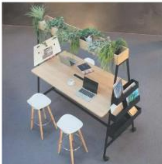
Station mobile Alto - Alto Mobile workstation