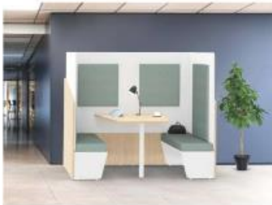
Cohesion Cohesion Workstation